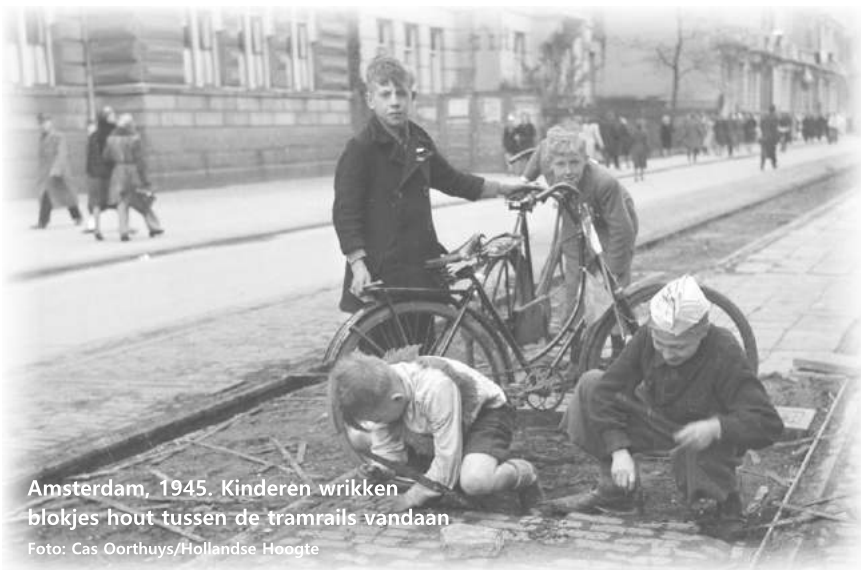
Amsterdam, 1945. Kinderen wrikken blokjes hout tussen de tramrails vandaan

'Het ergste moest nog komen. De geallieerden trokken op naar het noorden en toen Brabant al was bevrijd kwam bij ons de hele Hongerwinter nog. Er was niets meer: geen gas, geen licht, geen eten. Zelfs als je geld had, kon je nergens terecht, want er was gewoon niets. Alle bomen in de stad werden gekapt en mensen haalden zelfs de houten blokjes tussen de tramrails vandaan om ze op te stoken. Omdat er geen kolen meer waren, hadden we zo'n allesbrander bovenop de kachel staan, en daar stopten we alles in wat we konden vinden, voor een beetje warmte.'