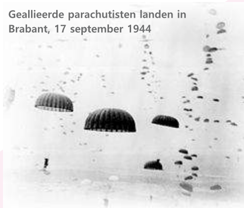
Geallieerde parachutisten landen in Brabant, 17 september 1944

In de zomer van 1944 stevende de bezetting af op een ontknoping. België was al bevrijd en het zuiden van Nederland wachtte in spanning op de eerste geallieerde troepen. Op dat moment werd in het diepste geheim de Operatie Market Garden voorbereid. Britse, Poolse en Amerikaanse luchtlandingstroepen zouden belangrijke bruggen over Nederlandse rivieren innemen bij Eindhoven, Arnhem en Nijmegen, waarna grondtroepen uit België via deze bruggen zouden opmarcheren. Berlicum lag aan de rand van deze marscorridor, pal in de vuurlinie. Het was de Amerikaanse 101e Luchtlandingsdivisie, bijgenaamd de Screaming Eagles, die op 17 september in het gebied rond Eindhoven werd gedropt. Cor zag de parachutisten naar beneden komen boven Heeswijk, met honderden tegelijk! 'Later heb ik begrepen dat Heeswijk een vergissing was. Ze hadden bij Veghel af moeten springen, vlakbij de brug over de Aa.' 'De Duitsers waren heel nerveus geworden,' herinnert Cor zich. 'Diezelfde dag, of een dag later, hoorde ik 's avonds een hoop geschreeuw en herrie in de keuken. Ik keek door een kier in de deur en