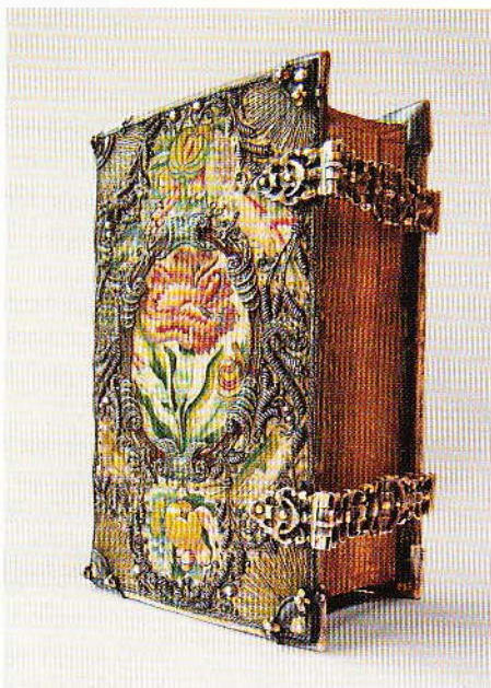
Franstalig gebedenboekje waarin het echtpaar Ranckx de geboortestand van hun kinderen bijhield. Parijs, 18de eeuw. Collectie Van Noordwijk

pen kregen vocht, schimmels en ongedierte geen kans. Aan het einde van de zestiende eeuw waren sluitingen veelal van messing, zoals te zien op een bijzonder en zeldzaam exemplaar uit 1598, waarin ruim vier eeuwen vroomheid geschiedenis is geworden. Later pas is de sluiting als versiering in zwang geraakt en gingen menen daarvoor vooral zil-