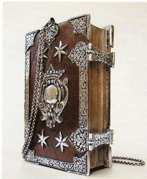
Hemelsch-Palmhofje', populair Rooms-Katholiek gebedenboekje. Goudkleurigbeslag op een paars fluwelen band. Mechelen, 19de eeuw. Collectie Van Noordwijk

de waarde die mensen toekenden aan het kerkboekje, dat generaties lang als trots familiebezit gekoesterd werd. Op de schutbladen zijn gevoelens van diepe blijdschap tot intens verdriet in inkt gesteld. Zoals in het bericht. '1781 11 feb morgens circa 2 uren is gebooren fredericus martinus' enzovoort, en enkele regels daaronder, 'gestorven op den 2. maart.'