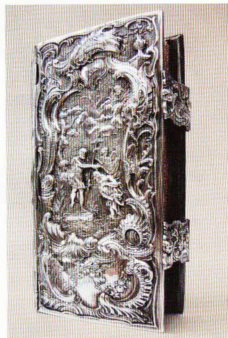
Op de zilveren boekband is de doop van Christus in de Jordaan afgebeeld. Augsburg, 17de eeuw. Collectie Van Noordwijk

een kerkboekje. Zonde vonden ze het, dat de oorspronkelijk functie verloren was gegaan. Ze gingen op zoek. In de loop van de jaren gingen duizenden kerkboeken