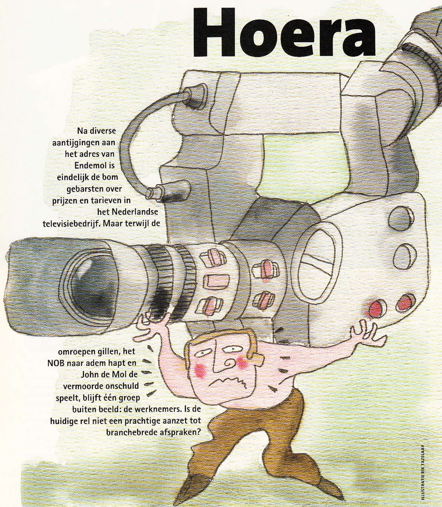
ILLUSTRATIE RIK TAZELAAR

omroepen gillen, het NOB naar adem hapt en John de Mol de vermoorde onschuld speelt, blijft één groep buiten beeld: de werknemers. Is de huidige rel niet een prachtige aanzet tot branchebrede afspraken?