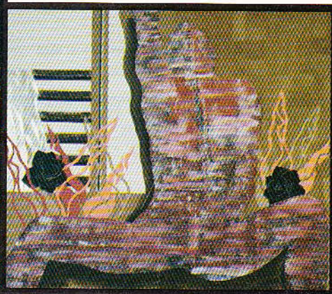
Onder: Zwarte roos, 138 x 168 cm, in gemengde techniek, van René Völker, verloren gegaan bij de ramp.